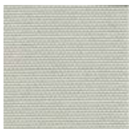
238 GRIGIO PERLA