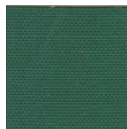
204 VERDE SCURO